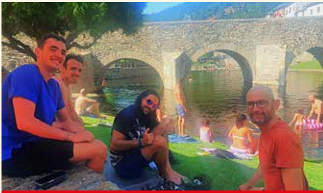
Un momento di relax al ponte romano di Molinaseca

A volte un gioco può cambiare il modo di guardare la vita. Per me è stato così con gli scacchi. Da quando ho imparato a muovere i pezzi, ho scoperto non solo una passione, ma anche un modo diverso di pensare e di conoscere le persone.