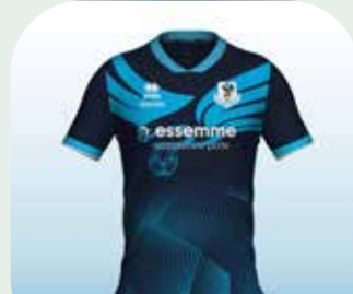
Le nuove maglie per la stagione 2025-2026