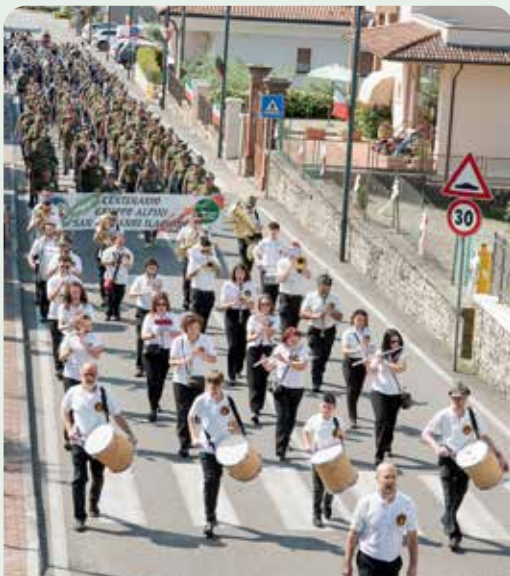
La sfilata per le vie del paese