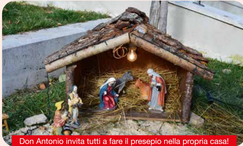
Don Antonio invita tutti a fare il presepio nella propria casa!

Il Natale affonda le sue radici in una storia di speranza e rinascita. La nascita di Gesù, simbolo di pace e amore, ci invita a riflettere sui valori più profondi della nostra esisten-