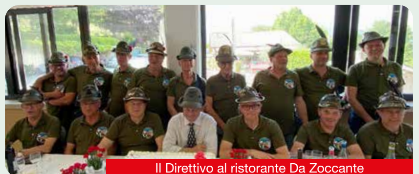
Il Direttivo al ristorante Da Zoccante