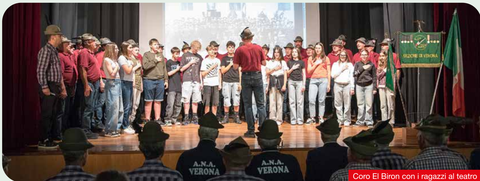
Coro El Biron con i ragazzi al teatro