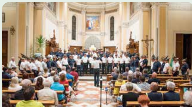
In chiesa, Coro El Biron e Coro Brigata Alpina Julia congedati

vata e riprovata. In sala non si sente volare una mosca per circa un'ora e mezza... tutti ammaliati dalle canzoni, dai racconti, dalle letture. Alla fine, scendendo dal palco, siamo avvolti da moltissimi abbracci e sorrisi che ci scaldano il cuore.