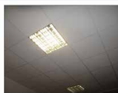
Foto n°1 - Individuazione del controsoffitto realizzato con pannelli in fibra minerale.

L'oggetto e caratteristiche dei lavori prevedono in specifico: 1) Scuola Primaria "A. Stefani": Sistema contro solaio antisfondellamento "a secco" per mq 126; Sistema contro solaio antisfondellamento "a secco" previa verifica idoneità ancoraggi in opera per mq 8; 2) Scuola Primaria "C. Tonin": Sistema contro solaio antisfondellamento "a secco" previa verifica idoneità ancoraggi in opera per mq 13. Il costo contrattuale è corrispondente a complessivi € 11.413,20, oltre IVA di legge.